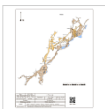
План План пещеры Пять озер, 2024г